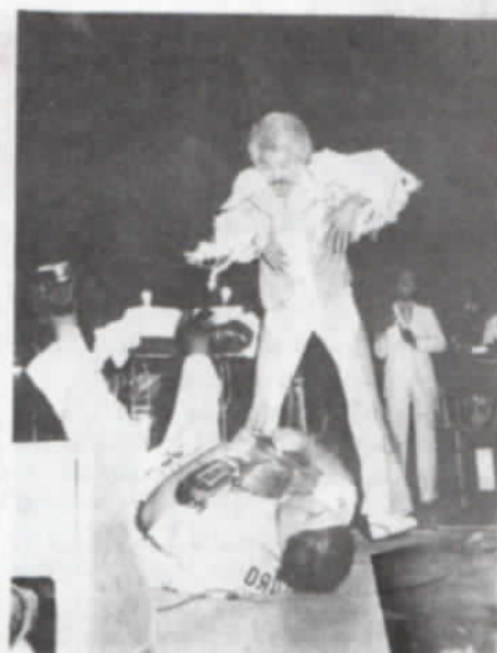
El show de Yomo Toro, hizo el delirio de la multitud.