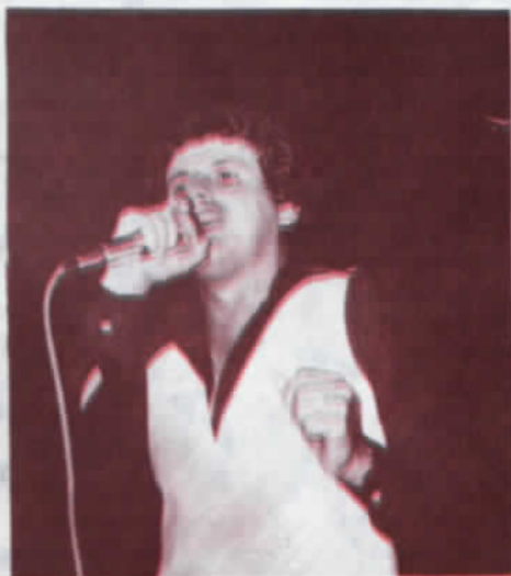
Con "Vuelve Cipriano", Ismael Miranda regresó a los puestos de honor.