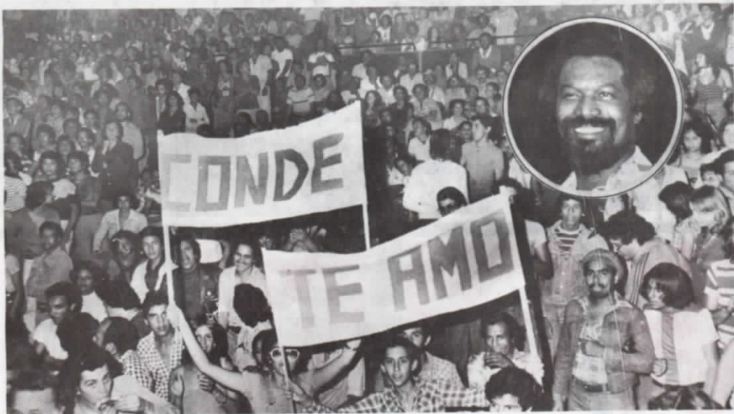
He aquí una prueba palpable de la admiración del público por estos famosos artistas, y en particular, de dos pavas por uno de sus cantantes.

Una manifestación de entusiasmo colectivo constituyó el último concierto efectuado en nuestro país por Las Estrellas de Fania. Casi 13 mil personas se congregaron en el gigantesco Poliedro de Caracas para tributarle una calurosa despedida a la que, sin duda alguna, es la más célebre de las bandas de la nueva salsa latina.