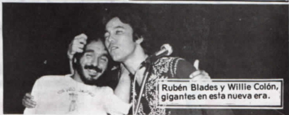
Rubén Blades y Willie Colón, gigantes en esta nueva era.