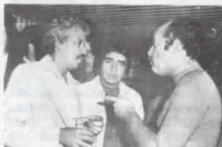
Nuestro Jefe de Redacción con el Director de Fania, durante el brindis de presentación a la prensa.