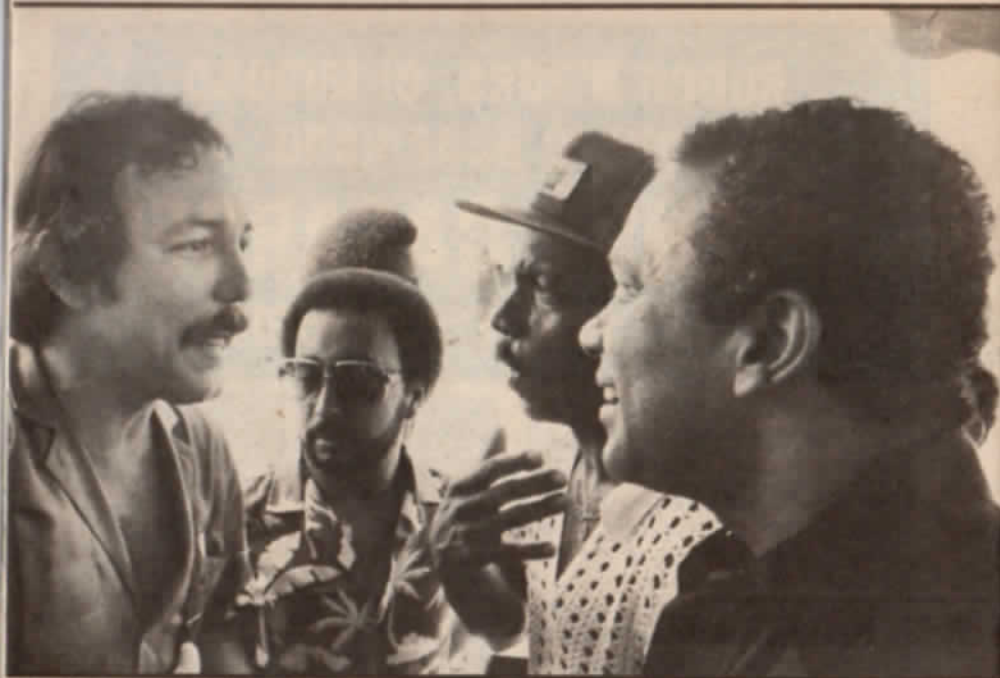
COMPARTIENDO CON PAPO LUCCA, ROBERTO ROHENA Y CHEO FELICIANO.

—El día que yo me case, mi mujer... mi compañera merecerá todo mi respeto y a mí no me van a ver rumbeando con nadie... Pero, como hasta ahora no he podido concentrar mi atención o mi admiración cien por ciento en una sola persona, pues no me he casado.