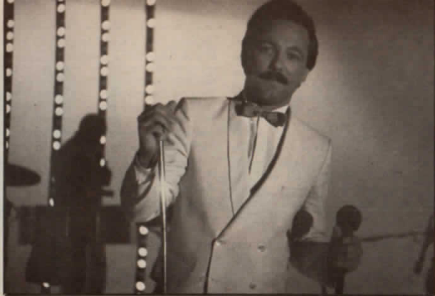
DURANTE SU ESTADIA, FILMO DOS "ESPECIALES" PARA WAPA-TV.