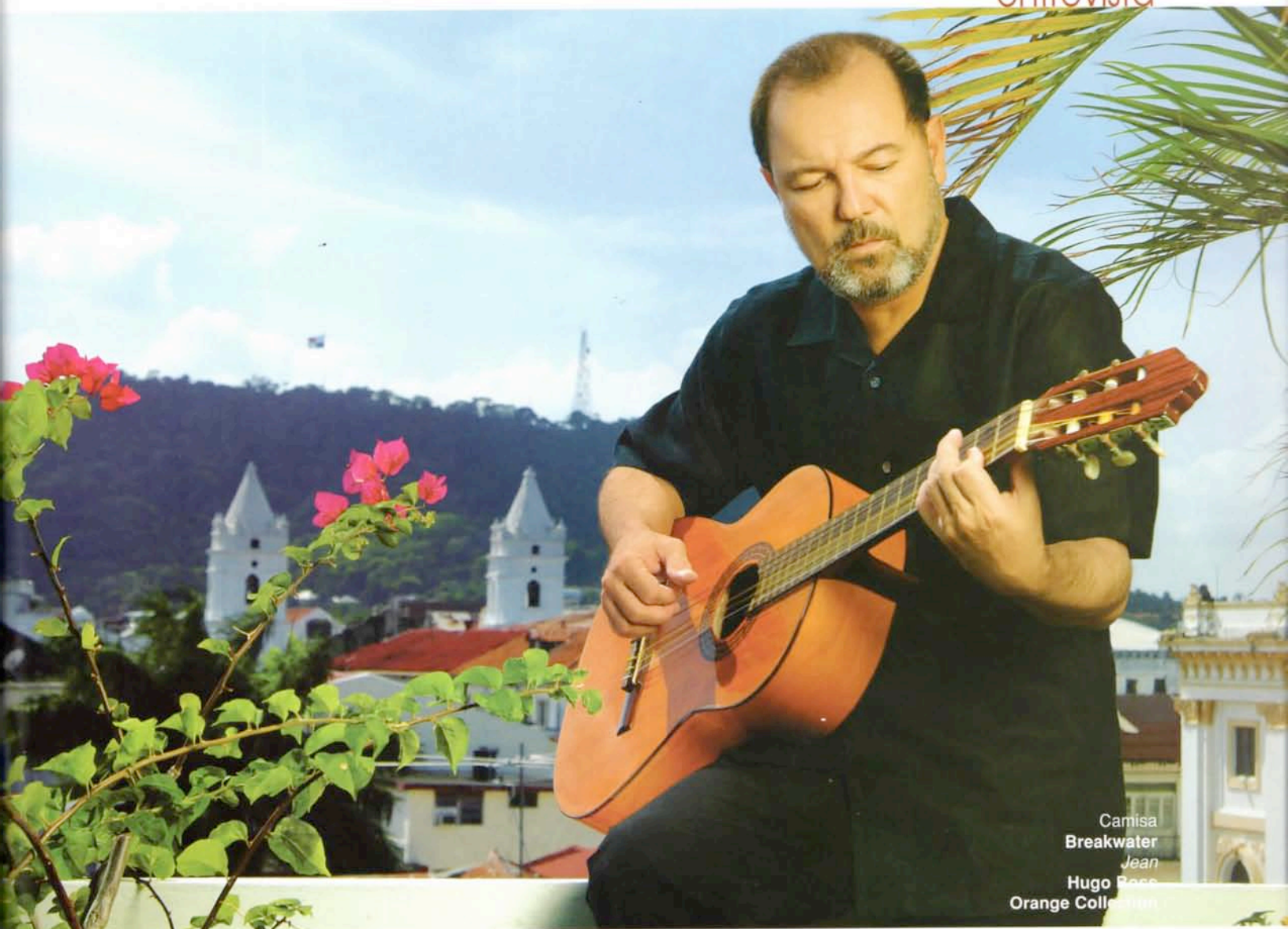
Camisa Breakwater Jean Hugo Boss Orange Collection

Soy fiel creyente en los proyectos a largo plazo, como artista no llegué a donde estoy pensando en el éxito inmediato o en el disfrute pasajero, llegué con un plan a largo plazo y eso es lo que estoy trarando de incorporar a nivel nacional.