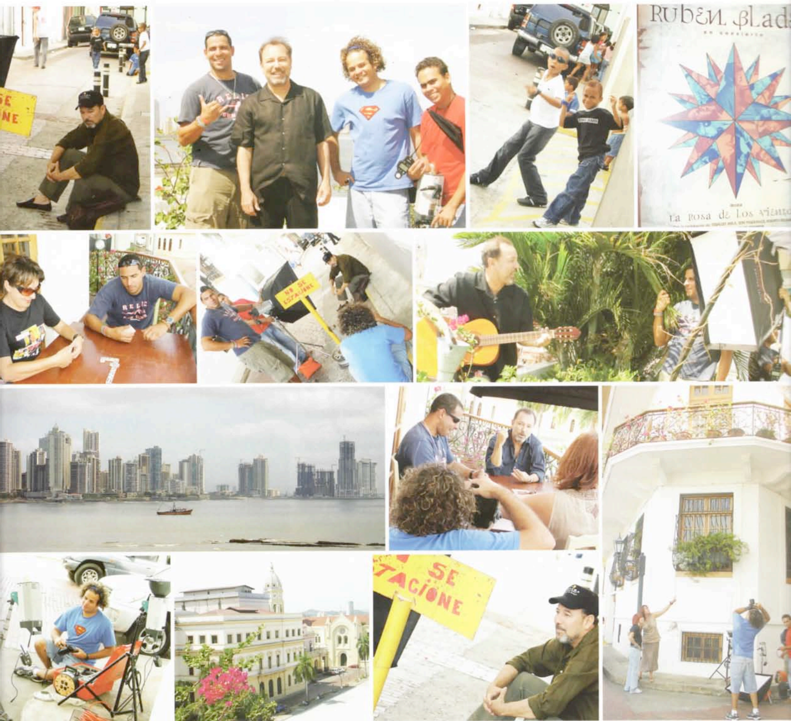
Tommy Hilfiger Estilismo Roger Trujillo Asistentes de Fotografía Luis Carlos Doraty y Josué Arosemena Fotografía (making of)